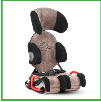
Carseat Pro (harmaa beige)