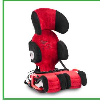
Carseat Pro (punainen)