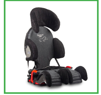
Carseat Pro (Alcantara)