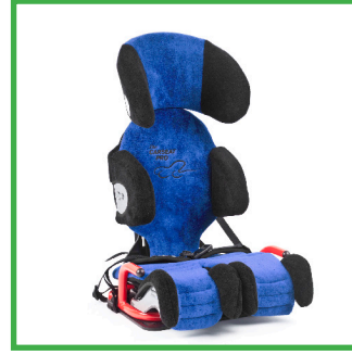
Carseat Pro (Sininen)