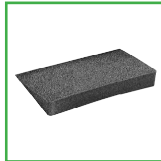
Kiila istuimen alle