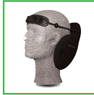
Otsapanta (pitkään pääntukeen)