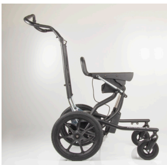
Istuinkorkeus 68 cm