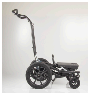
Istuinkorkeus 32 cm